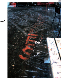
FOTO PER MORTEN ABRAHAMSEN ANNETTE SKOV THEOFANIS MELAS MUHANAD RASHEED KITT JOHNSON JERRY BERGMAN SUSANNE BONDE (tegning)

TEKNISK ASSISTANCE MARKUS HOFFMANN GRAFISK DESIGN NETE BANKE/IMPERIET